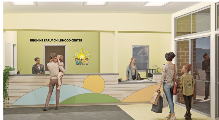
Centro Sunshine Early Childhood ● ● ● ● ● ● ● ●