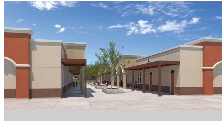
Escuela Primaria Magnolia ● ● ● ● ● ● ● ●