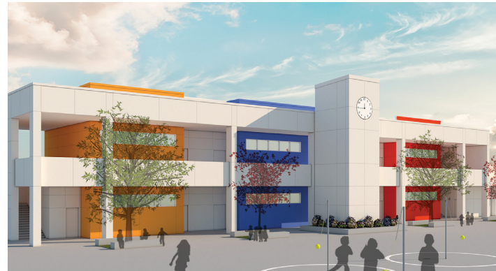
Escuela Primaria Jackson ● ● ● ● ● ● ● ●