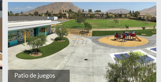
Patio de juegos