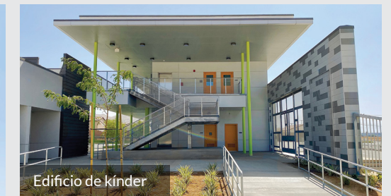
Edificio de kínder